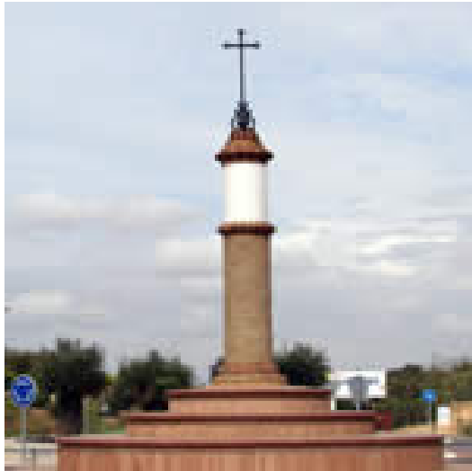
FOTO: LA CRUZ, SIMBOLO CIGARRERO