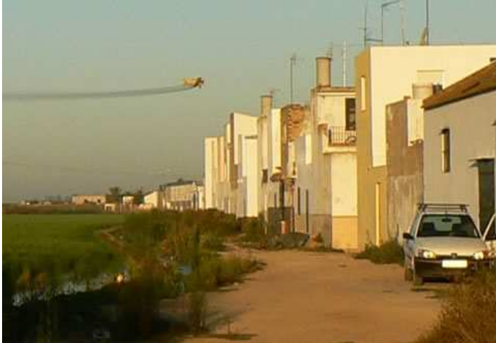
FOTO: Avioneta, arroz y viviendas.