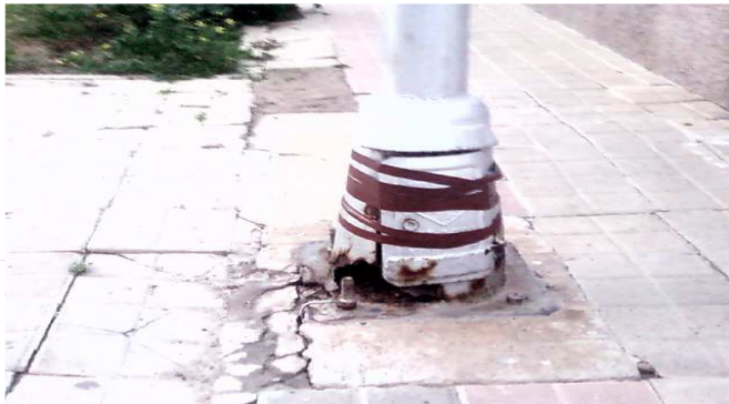
FOTO 2.- FAROLA PODRIDA COGIDA CON CINTA AISLANTE.