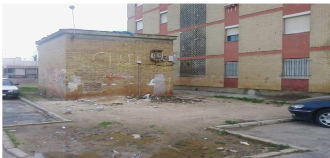
FOTO 3.- ESTACION ELECTRICA TERCERMUNDISTA CON BASURAS JUNTO A VIVIENDAS.