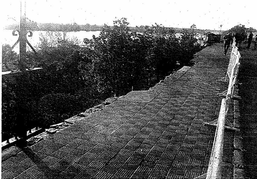
Estado en el que ha quedado el mirador de Las Palmillas tras el derrumbe del barranco

Los populares recriminaron a Álvarez que pese a los avisos no incluyera la zona siniestrada en las obras que se programaron con los fondos estatales de reactivación económica. «¿Porqué —dijo— ha gastado del "Plan E" 600.000 euros (100 millones de pesetas) en tres inmensas naves sin uso en el Boulevard Alfonso X, frente al Instituto y que nadie ha pedido y no ha acometido la mejora del talud de Las Palmillas, que tanta gente le ha solicitado debido a su peligrosidad?». Tras ello sugirió al alcalde que pida la declaración de zona catastrófica para la localidad.