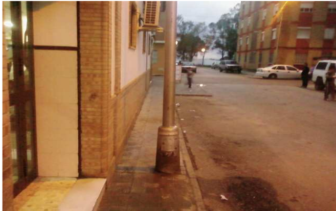
FOTO 1. FAROLA EN MEDIO DEL ACERADO.