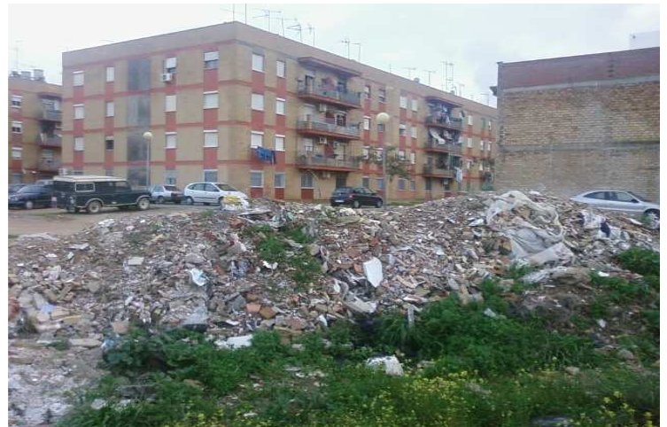
FOTO 5. ESTERCOLERO JUNTO A VIVIENDAS.

LA BARRIADA DE LA CRUZ, BARRIO OBRERO Y TRABAJADOR, NECESITA URGENTEMENTE INVERSIONES EN PARQUES, JARDINES, MOBILIARIO INFANTIL, URBANO Y ZONAS DEPORTIVAS.