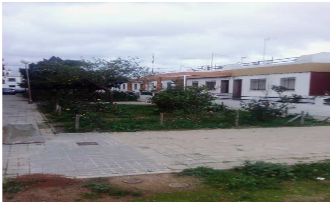
FOTO 4.- FLORES PLANTADAS, REGADAS Y CUIDADAS POR LOS PROPIOS VECINOS.